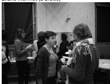
Echanges autour du buffet